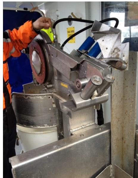
Bilde 2. Kraftigere magneter fanger bedre opp de renskede krokene.