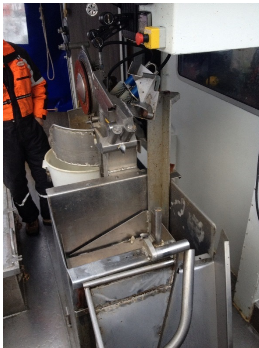
Bilde 4. Rekkerull montert rett over dekket (til venstre), og føring av line mellom overflaten, rull og andøver (til høyre).