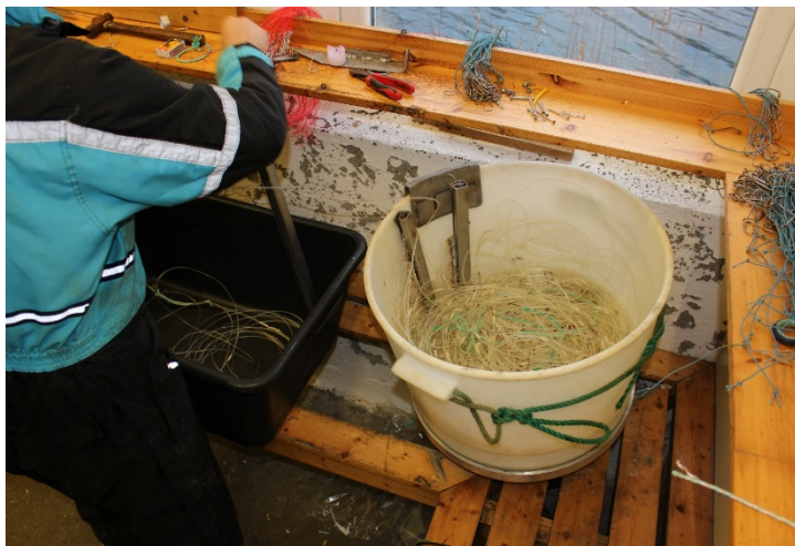
Bilde 3. Spesialdesignede magasin for å letter kunne ta snurr av lina.