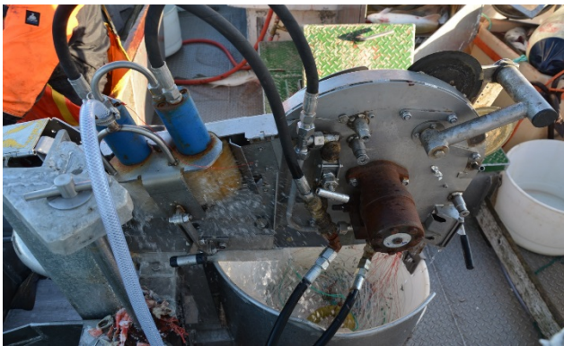
Bilde 1. Kveiler med roterende børster